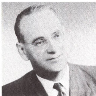
Carl Lutz.

Im Jahr 1944 gelang es Carl Lutz, dem damaligen Schweizer Vizekonsul und Leiter der Schutzmachtabteilung in Budapest, durch eine geniale Methode, Tausenden von ungarischen Juden das Leben zu retten. Ihm zu Ehren soll im kommenden Dezember im Zentrum der ungarischen Hauptstadt ein Bronzedenkmal eingeweiht werden. Der 1975 im Alter von 80 Jahren verstorbene Carl Lutz beschloss während des Zweiten Weltkrieges zusammen mit einigen Gleichgesinnten, ohne Auftrag oder Rückendeckung durch seine Vorgesetzten, möglichst viele der vom Tod bedrohten Ungarn jüdischer Herkunft in Sicherheit zu bringen. Zu diesem Zweck erfand er «Schweizer Kollektivpässe», indem er von den Deutschen für 5000 «Einheiten» zugestandene Schutzbriefe auf 5000 «Grossfamilien», also rund 44000 Menschen ausdehnte. Dem ungarischen Initiativkomitee ging es vor allem darum, endlich die «historische Ungerechtigkeit» zu beseitigen, dass Carl Lutz bis anhin immer im Schatten des Schweden Raoul