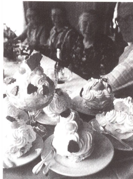
Klassisches Emmentaler Dessert.

ersten Blick auf Altvertrautes zu stossen glaubt, wie z. B. auf das Telldenkmal in Altdorf, auf den zweiten Blick aber merken muss, dass die Heimatatmosphäre in diesem Fall durch den respektlosen Kirschensteinspucker im Vordergrund empfindlich gestört wird. Noch provokativer folgende «Kombination»: Ein junger Soldat im Kämpfer-Anzug steht vor einer Hausmauer, auf welche die Frage «Kennt man dich?» gespritzt ist (unser Bild). Obwohl alle Szenen