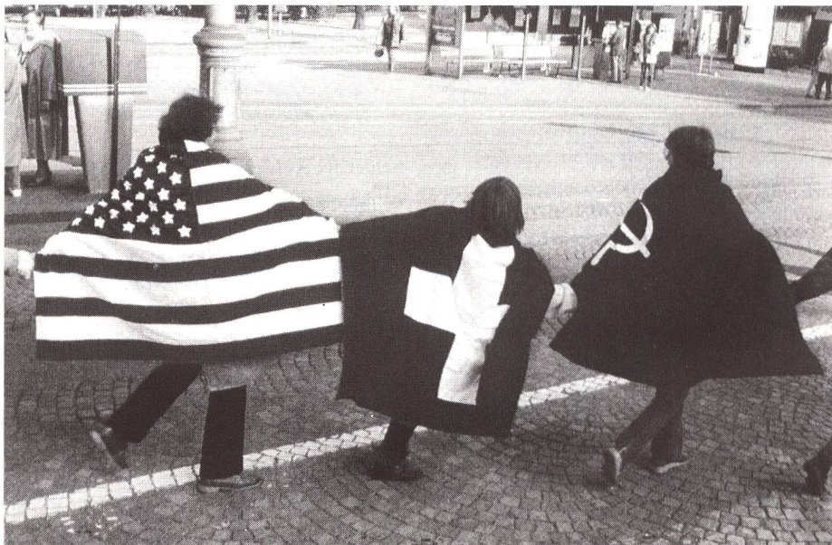
Ost und West verbinden sich.

Ein Grundzug dieser Bildergalerie zum Thema Schweiz besteht darin, dass man auf den