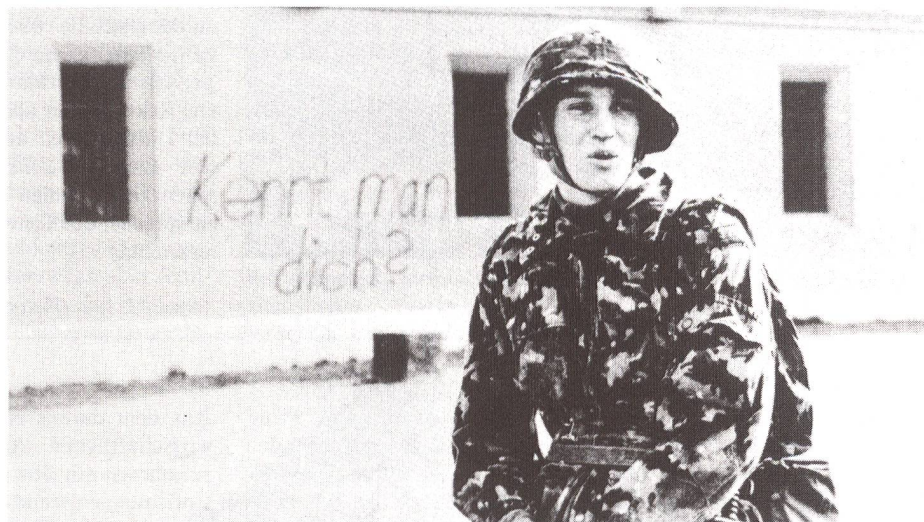
Die Armee ist durch die Abschaffungsinitiative in letzter Zeit stark unter Beschuss geraten.