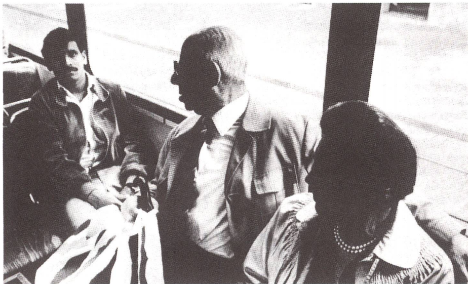
Das Misstrauen gegen Fremde, ob berechtigt oder nicht, ist vielerorts sehr gross.