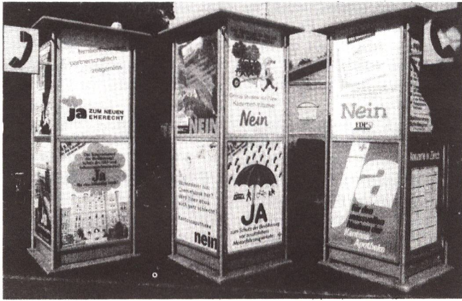
Dutzende kommunale, kantonale und eidgenössische Vorlagen pro Jahr: die direkte Demokratie als typisch schweizerische Form der Demokratie des Alltags.

fasziniert ist. Ich habe von mehreren Gesprächspartnern gern die Erklärung vernommen, Initiative und Referendum seien ein hervorragendes Mittel zur Kontrolle der Exekutive, und auch über der Legislative schwebende, dem Schwert des Damokles gleich, die Möglichkeit einer Volksabstimmung. Die Macht werde einerseits begrenzt, andererseits entstehe so Gelegenheit, alles stets von neuem zu überdenken, so dass extreme Lösungen verhindert würden. Mag sein, dass die schweizerische Innenpolitik, von aussen gesehen, deshalb etwas eintönig erscheint.