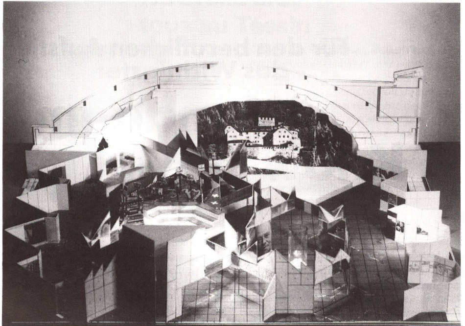
Liechtenstein stellt sich als Gastland beim Comptoir Suisse in Lausanne wirtschaftlich, kulturell und sportlich vor. Unser Bild zeigt das Ausstellungsmodell, das vom Atelier Louis Jäger geschaffen wurde.

Das Konzept der liechtensteinischen Präsenz in Lausanne, bei der Staat, Wirtschaft, Kultur und Sport zusammenarbeiten, stellt neben einer ganzheitlichen Darstellung des Landes die menschliche Begegnung in den Vordergrund. Mehr als 20 Gruppen und Vereine gestalten ein abwechslungsreiches sportliches und kulturelles Veranstaltungsprogramm in und um Lausanne. Dazu kommen Auftritte liechtensteinischer Vereine und Gruppen in der Liechtenstein-Halle, im Ausstellungsgelände (Palais de Beaulieu) sowie Spezialausstellungen ausserhalb des Comptoir-Geländes – eine Briefmarkenausstellung im Musée Olympique, die Ausstellung «Zeitgenössisches Kunstschaffen aus Liechtenstein» in Pully und eine Liechtenstein-Ausstellung im Rathaus der Stadt Lausanne.