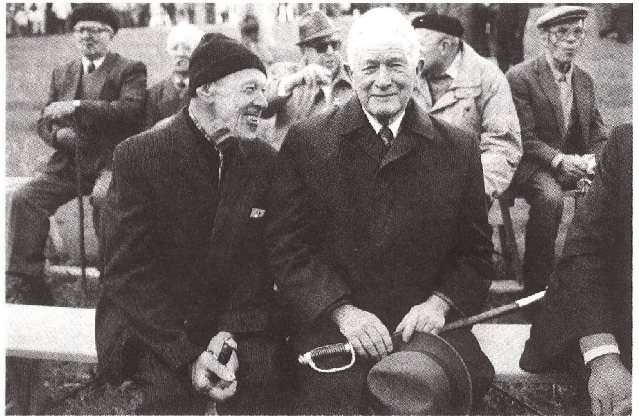
Zum letztenmal unter sich: Ausserrhoder Männer an der Landsgemeinde (mit Waffe als Stimmausweis).

Auch die Kantone gehen dazu über, Büros für Gleichstellung zu errichten. Im Frühling 1989 waren bereits vier kantonale Stellen in Funktion (Jura, Genf, St. Gallen, Basel-land). Vorbereitungen für die Eröffnung weiterer Frauenstellen laufen momentan in den Kantonen Bern, Luzern, Basel-Stadt,