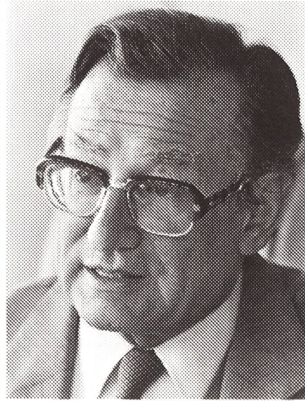
Professor Dipl. Ing. Martin Hilti, Konzernchef der internationalen Hilti-Gruppe

io gilt als führende Fachschrift des modernen Manage-