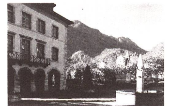
Vouvry VS

Heimat zum Ort der Versorgung im Notfall erklärte, hat vielen Menschen Schwierigkeiten gemacht und diese Heimat