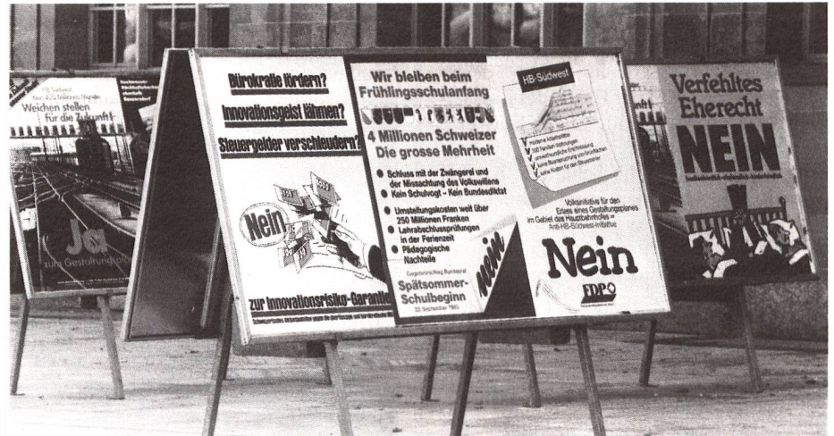
Volksrechte Initiative und Referendum: Die Frage nach der EG-Kompatibilität von neuen Schweizer Gesetzen stellt sich mit oder ohne EG-Beitritt.

Die anfänglich noch angezweifelte, durch die Konsolidierung und stete Erweiterung indessen bestätigte Irreversibilität des EG-Integrationsprozesses zwang die Schweiz je-