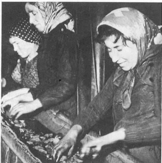
Frauen beim Sortieren von Anthrazit, Wallis 1947.

Besonders «reich an armen Minen» ist die Schweiz bei Metallen wie Blei, Zink oder Kupfer, wo während der letzten Jahrhunderte im ganzen Alpenraum kleinere Lagerstätten abgebaut wurden. Ob Goppenstein am Ausgang des Lötschbergtunnels etwa zerfallen die Anlagen des 1952 aufgegebenen Blei-Zink-Bergwerks.