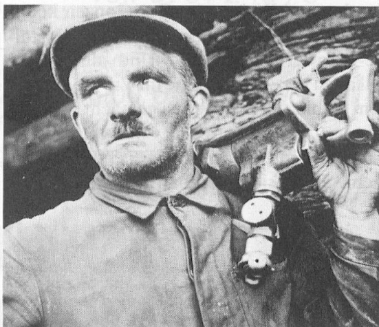
Bergarbeiter, Wallis 1947.

Gold ist ein besonderer Stoff. In Stollen gewinnen liess er sich bei Gondo am Simplon, am Calanda (Bergwerk «Goldene Sonne») unweit Chur, ob Salanfe im Unterwallis sowie bei Astano im Tessin; hier in der Süd-schweiz wird übrigens durch ein ausländisches Unternehmen die Wiederaufnahme des Bergbaus studiert.