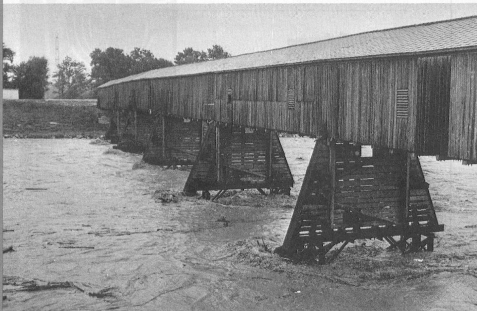
Alte Rheinbrücke zwischen FL und CH.