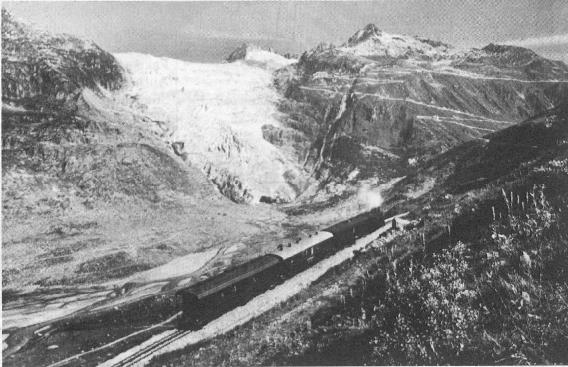
Eine historische Aufnahme: Der Glacier-Express auf der nun stillgelegten Bergstrecke vor dem Rhonegletscher.