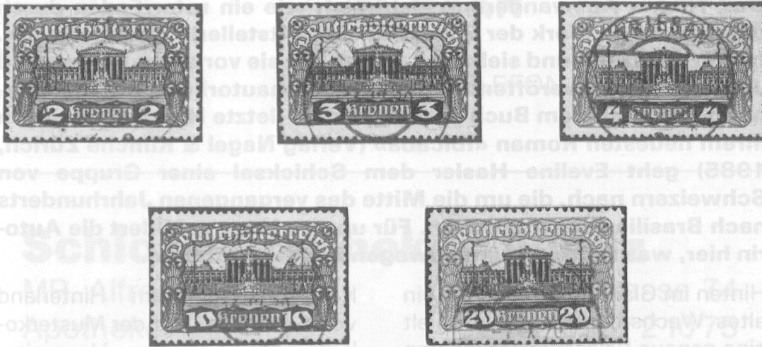
Abb. 3: Österr. Kronenwerte mit Stempel TRIESEN, sogen. Mitläufer.

ber 1921 in Liechtenstein gültig waren, sind die heute gesuchten Schweiz-Mitläufer. Die Schweizer Portomarken waren hier bis 11. April 1928 und die Flugpostmarken der Schweiz sogar bis 11. August 1930 kursgültig. Da kann man wirklich die schönsten Sammlungen zusammenstellen,