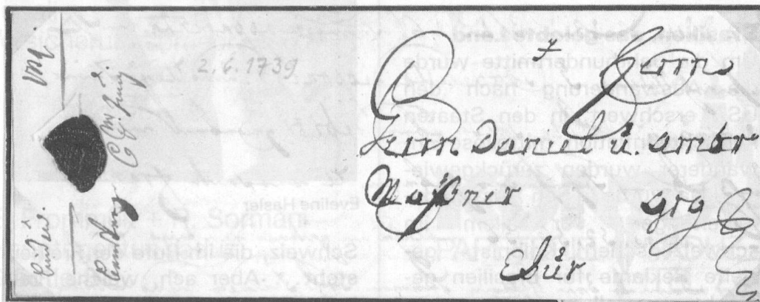
Abb. 4: Kaufmannsbrief von 1739, LINDAU-CHUR

Il messaggero di Lindò... va e viene - quando può!