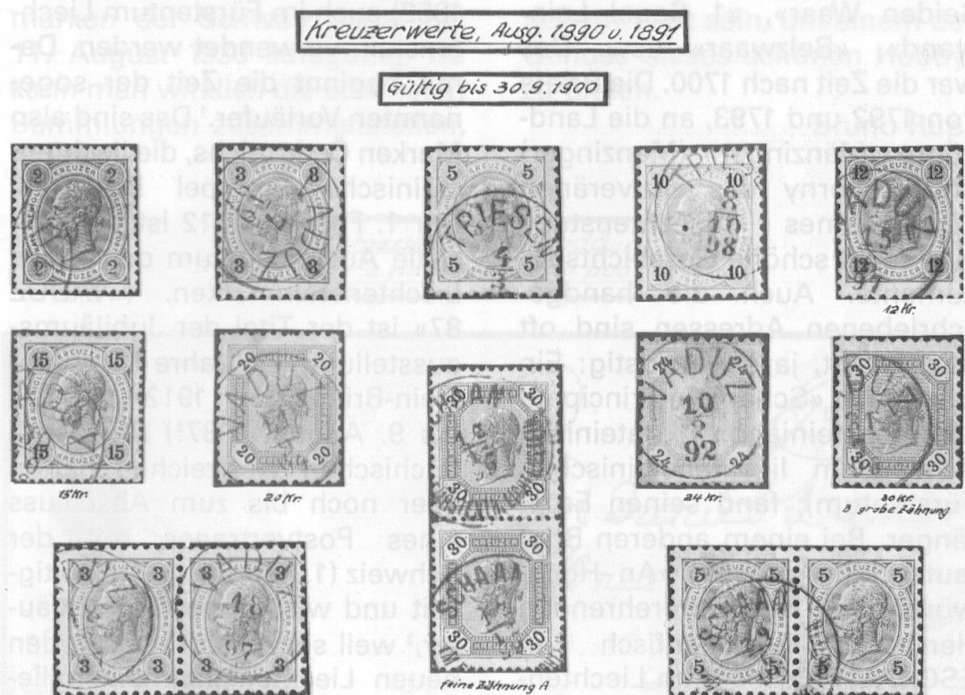
Abb. 1: Österreichmarken mit Liechtenstein-Stempeln, sogen. Vorläufer