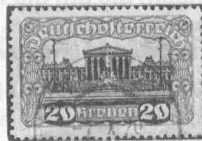
Abb. 3: Österr. Kronenwerte mit Stempel TRIESEN, sogen. Mitläufer.

ber 1921 in Liechtenstein gültig waren, sind die heute gesuchten Schweiz-Mitläufer. Die Schweizer Portomarken waren hier bis 11. April 1928 und die Flugpostmarken der Schweiz sogar bis 11. August 1930 kursgültig. Da kann man wirklich die schönsten Sammlungen zusammenstellen,