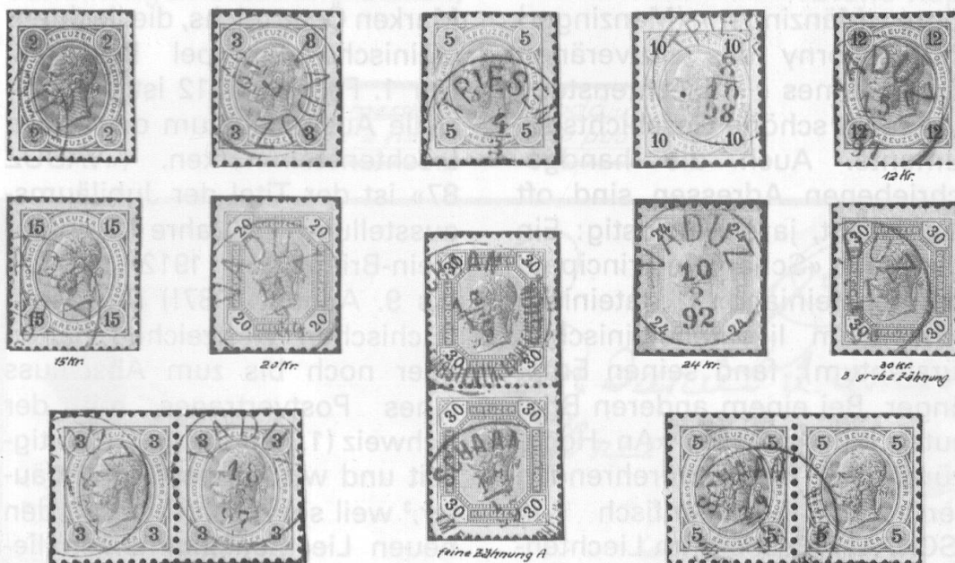
Abb. 1: Österreichmarken mit Liechtenstein-Stempeln, sogen. Vorläufer