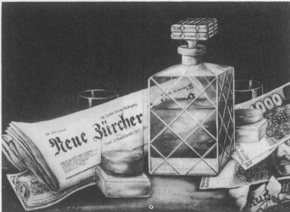
„Zürich's Seele ist überall“

Diese einzigartigen Originale sind zu besichtigen in der Galerie auf Runkels, Triesen, Tel.075/24752.