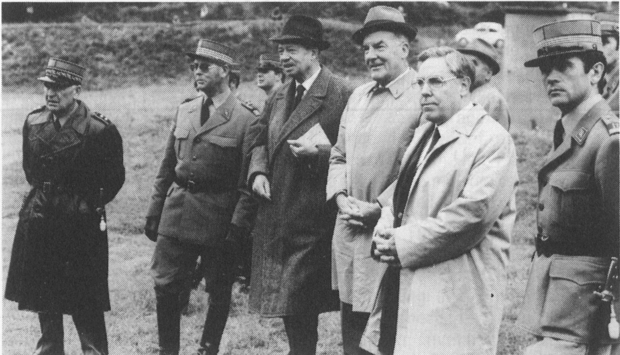
Auf Einladung des Schweizer-Vereins: Besuch des Landesfürsten bei der Train-Rekruten-Schule St. Luzisteig in Gegenwart von Bundesrat R. Gnägi am 24.9.1974