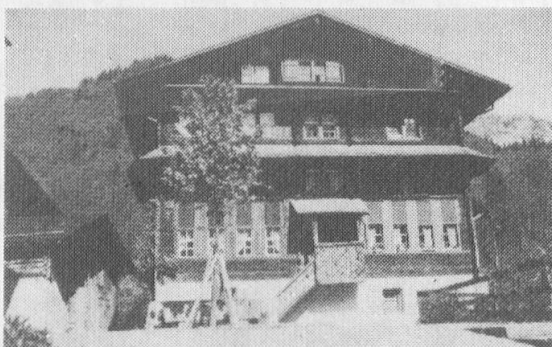
Das Grosshaus im Dorfkern von Elm, ein ehemaliges Gerichtsgebäude

Elm erhielt 1521 seine Kirche. Dieser Touristenort weist aber auch noch einige schöne alte Giebelhäuser auf, wie z.B. das Grosshaus und das Zentnerhaus aus der zweiten Hälfte des 16. Jahrhunderts und das Suwarow-Haus von 1748. Eine grossartige Bergwelt mit vielen Tourenmöglichkeiten umgibt Elm. Von Norden bis Westen schwingen sich Gatstock, Karrenstock und Kärpf in den Himmel, deren Flanken das älteste Wild- und Pflanzenreservat der Schweiz beherbergen; es geht auf den 10. August 1548 zurück und umfasst heute eine Fläche von 100 km 2 . Hausstock, Chalchhorn und Vorab bilden die grossartige Kulisse von Westen bis Süden, Zwölfi- und Mittagshorn, Laaxerstöckli, Tschingelhörner, Piz Segnes, Surenstock und Fanenstock die interessante Begrenzung von Süden bis Osten.