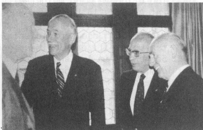
links: W.Stettler mit dem franz. Militärattaché in Bern, Oberst Godard