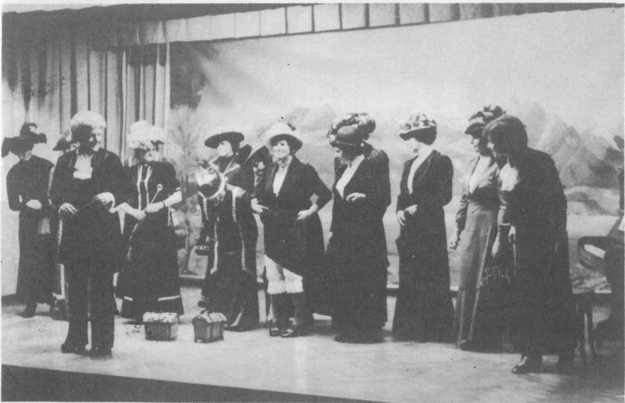
Der Nostalgiechor Sirnach TG, auch genannt "Die Lustigen Weiber von Sirnach", in ihren Kleidern "aus Grossmutter's Zeiten", ihren nostalgischen Liedern und ihren ulkigen Auftritten.