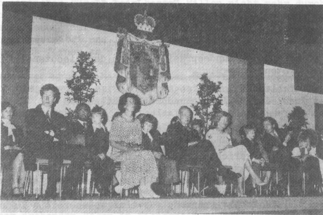
Geburtsstagsfeier in Vaduz. Die fürstliche Familie auf der Ehrentribüne.

Warum ist eigentlich gerade der 15. August liechtensteinischer Staatsfeiertag? Nun, das Datum hängt mit dem Geburtstag des Fürsten zusammen. Fürst Franz Josef II. von und zu Liechtenstein ist der erste Fürst, der dauernden Wohnsitz im Land genommen hat und damit die Verbundenheit zwischen Volk und Fürstenhaus begründet und gefestigt hat. Am 5. August 1940 erklärte die Regierung das Fest Mariä Himmelfahrt – den Vortag des fürstlichen Geburtstages – zum liechtensteinischen Staatsfeiertag und ordnete ein "feierliches Hochamt mit Predigt Tedeum und sakramentalem Segen, Böllerschüsse um 5 Uhr beim ersten Läuten, beim Zusammenläuten, ferner bei Evange-