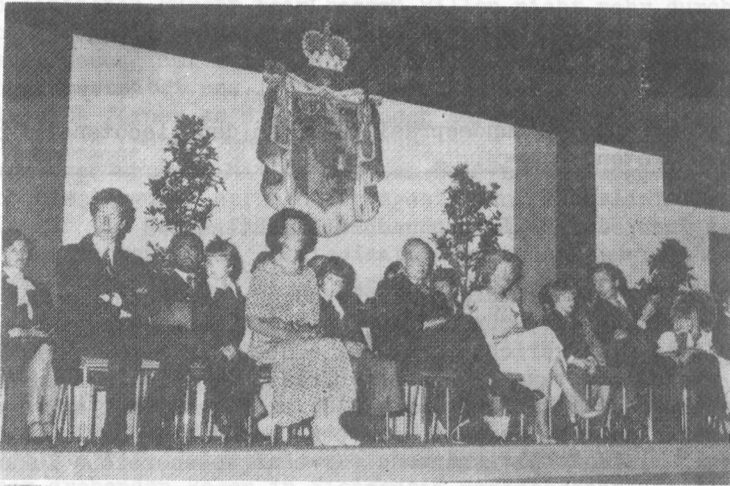
Geburtsfeier in Vaduz. Die fürstliche Familie auf der Ehrentribüne.

Warum ist eigentlich gerade der 15. August liechtensteinischer Staatsfeiertag? Nun, das Datum hängt mit dem Geburtstag des Fürsten zusammen. Fürst Franz Josef II. von und zu Liechtenstein ist der erste Fürst, der dauernden Wohnsitz im Land genommen hat und damit die Verbundenheit zwischen Volk und Fürstenhaus begründet und gefestigt hat. Am 5. August 1940 erklärte die Regierung das Fest Mariä Himmelfahrt - den Vortag des fürstlichen Geburtstages - zum liechtensteinischen Staatsfeiertag und ordnete ein "feierliches Hochamt mit Predigt Tedeum und sakramentalem Segen, Böllerschüsse um 5 Uhr beim ersten Läuten, beim Zusammenläuten, ferner bei Evange-