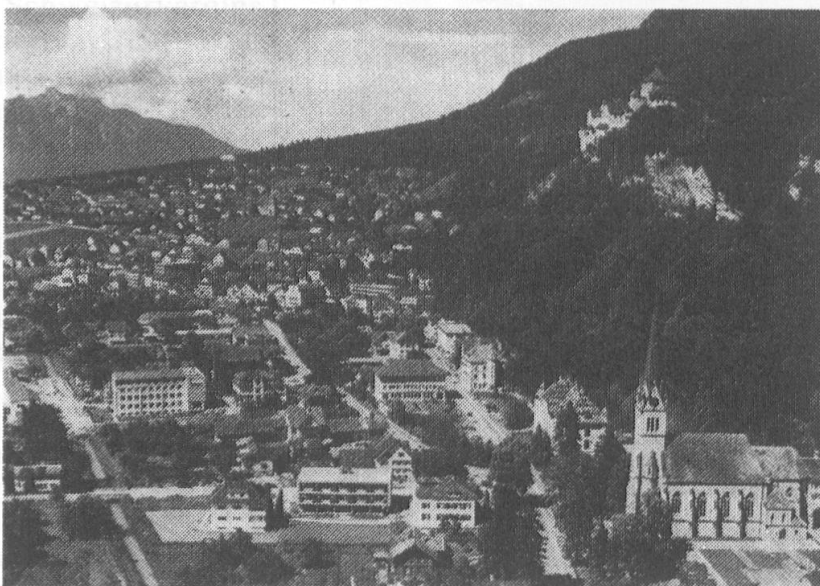
Oben: Hauptort Vaduz