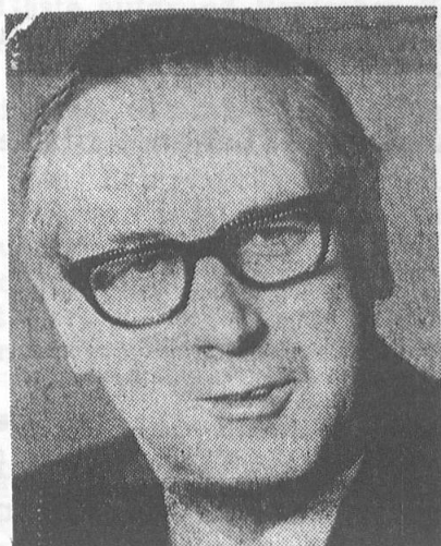
Bundesrat Hans Hürlimann

Die Ersatzwahlen vom 5. Dezember 1973 in den Bundesrat brachten zwar Sensationen, aber keine Ueberraschungen; jeweils im ersten Wahlgang wurden der Zuger Ständerat Hans Hürlimann, der Lausanner Stadtpräsident Georges André Chevallaz und der Solothurner Regierungsrat Willi Ritschard als Nachfolger der scheidenden Bundesräte Roger Bonvin, Nello Celio und Hanspeter Tschudi gewählt.