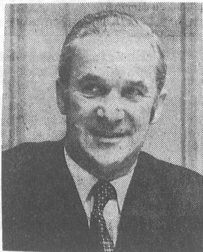
Nationalratspräsident Dr. Anton Muheim

Zu Beginn der dreiwöchigen Wintersession wählten beide Kammern neue Präsidenten. Neuer Nationalratspräsident wurde mit 146 Stimmen der 57jährige Luzerner Sozialdemokrat Dr. Anton Muheim. Im Ständerat wurden alle 41 gültigen Stimmen für den 55jährigen Schaffhauser Freisinnigen Dr. Kurt Bächtold abgegeben.