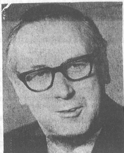
Bundesrat Hans Hürlimann

Die Ersatzwahlen vom 5. Dezember 1973 in den Bundesrat brachten zwar Sensationen, aber keine Ueberraschungen; jeweils im ersten Wahlgang wurden der Zuger Ständerat Hans Hürlimann, der Lausanner Stadtpräsident Georges André Chevallaz und der Solothurner Regierungsrat Willi Ritschard als Nachfolger der scheidenden Bundesräte Roger Bonvin, Nello Celio und Hanspeter Tschudi gewählt.