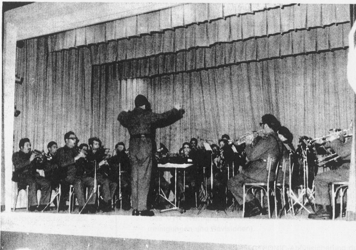
Das Spiel Inf.Rgt.72 beim Konzertvortrag im Rathaussaal in Vaduz

Auf Wiedersehen und Wiederhören - recht gern. Und weiterhin en guete Diensch und namal herzliche Dank.