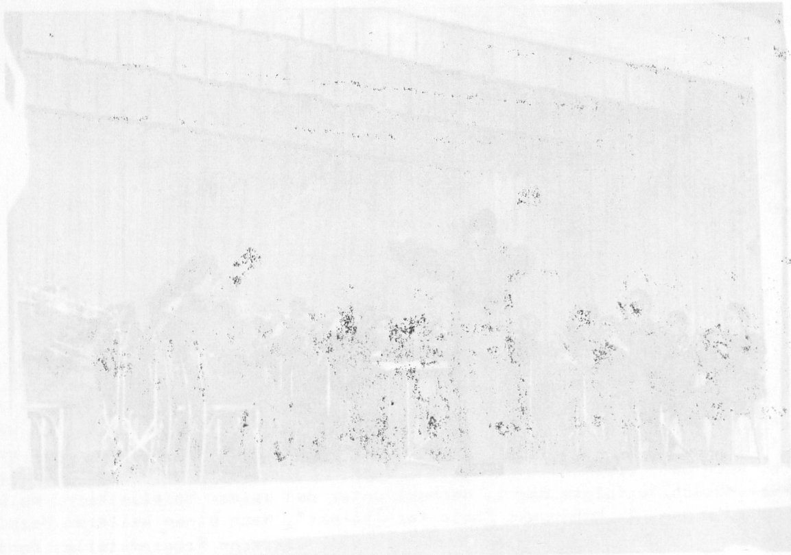
Das Spiel Inf. Nr. 75 beim Konzertvortrag im Rathssaal in Vaduz

Auf Wiedersehen und Wiederhören - recht gern. Und weiterhin an guter Dienstadt und namal herrliche Dank.