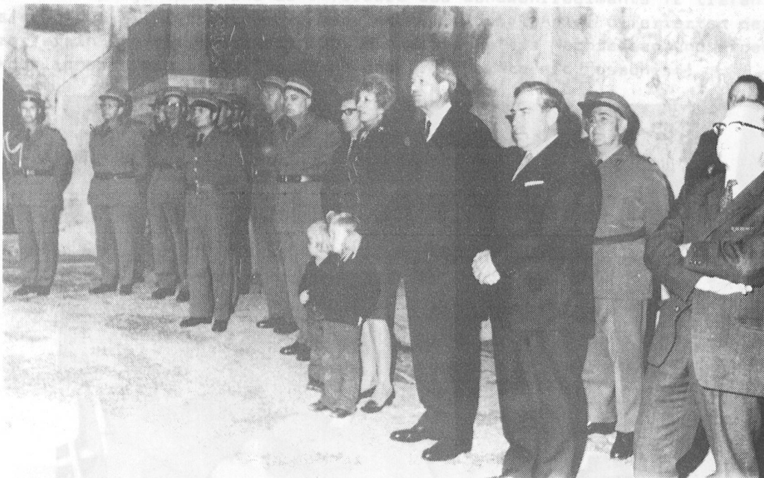
Interessierte Zuhörer beim "Ständchen"