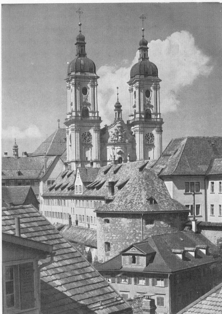
Stiftskirche St. Gallen

Redaktion und Administration: Schweizer-Verein im Fürstentum Liechtenstein, Postfach, Vaduz