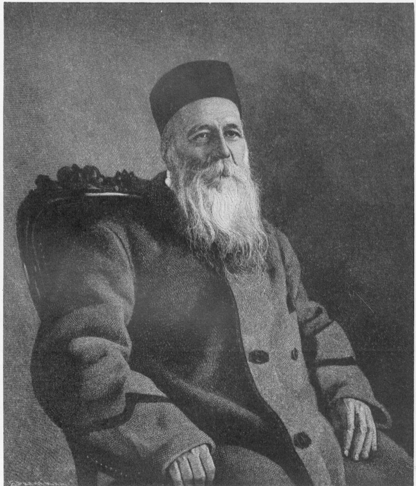
Henri Dunant 1828 – 1910 Gründer des Roten Kreuzes

Redaktion: Schweizer-Verein im Fürstentum Liechtenstein, Postfach, Vaduz