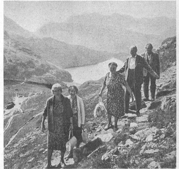
Bergwanderung auf dem Jochpass (2215 m ü.M.), an der über 40 «Home»-Gäste teilnahmen. Im Hintergrund der Engstlensee. Unser Bild: «Home»-Gäste aus Deutschland