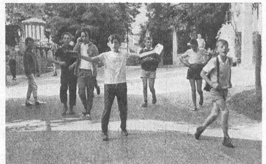
Pro-Juventute-Auslandschweizer-Kinder im «Home» – Enfants suisses Pro Juventute de l'étranger au «Home»

«Home» pour Suisses de l'étranger... un pied-à-terre dans la patrie