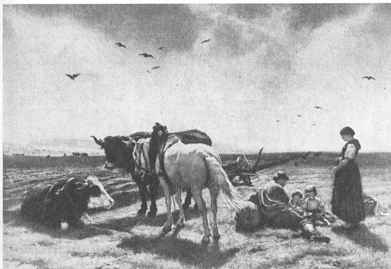
Rudolf Koller, Zürich, 1828–1905: Mittagsrast auf dem Felde. Museum Luzern

Das wären einige Stellen aus den Büchern Rousseaus, die uns Einblicke in sein Denken und Fühlen gewähren. Vergessen wir nicht, dass die grossen Schweizer des 18. Jahrhunderts, welche vor zweihundert Jahren im Bad Schinznach die Helvetische Gesellschaft gründeten, für Rousseau eine grosse Verehrung und Freundschaft empfanden. Sie fühlten sich ihm geistig verwandt. Der Basler Iselin, die Zürcher Lavater, Hess, Usteri, Füssli und Escher von der Linth, der Brugger Zimmermann, die Berner Tschiffeli, Tschanner und Fellenberg, der Appenzeller Zellweger bekundeten in ihrem Briefwechsel grosses Interesse für ihn. Einige besuchten ihn oder machten sogar ihre Hochzeitsreise zu ihm ins Val de Travers. Unter Rousseaus Einfluss kam der junge Pestalozzi auf den Gedanken, auf dem Birrfeld als Bauer und Erzieher neue Wege zu gehen. Auch Schiller, der Verherrlicher der menschlichen Freiheit, bekam