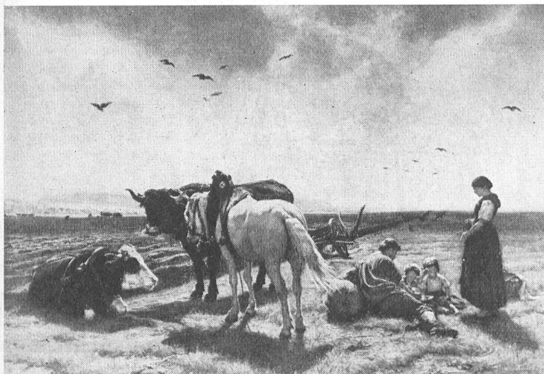
Rudolf Koller, Zürich, 1828–1905: Mittagsrast auf dem Felde. Museum Luzern

Das wären einige Stellen aus den Büchern Rousseaus, die uns Einblicke in sein Denken und Fühlen gewähren. Vergessen wir nicht, dass die grossen Schweizer des 18. Jahrhunderts, welche vor zweihundert Jahren im Bad Schinznach die Helvetische Gesellschaft gründeten, für Rousseau eine grosse Verehrung und Freundschaft empfanden. Sie fühlten sich ihm geistig verwandt. Der Basler Iselin, die Zürcher Lavater, Hess, Usteri, Füssli und Escher von der Linth, der Brugger Zimmermann, die Berner Tschiffeli, Tschanner und Fellenberg, der Appenzeller Zellweger bekundeten in ihrem Briefwechsel grosses Interesse für ihn. Einige besuchten ihn oder machten sogar ihre Hochzeitsreise zu ihm ins Val de Travers. Unter Rousseaus Einfluss kam der junge Pestalozzi auf den Gedanken, auf dem Birrfeld als Bauer und Erzieher neue Wege zu gehen. Auch Schiller, der Verherrlicher der menschlichen Freiheit, bekam