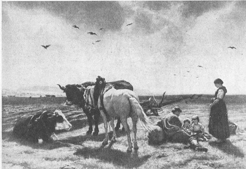
Rudolf Koller, Zürich, 1828–1905: Mittagsrast auf dem Felde. Museum Luzern

Das wären einige Stellen aus den Büchern Rousseaus, die uns Einblicke in sein Denken und Fühlen gewähren. Vergessen wir nicht, dass die grossen Schweizer des 18. Jahrhunderts, welche vor zweihundert Jahren im Bad Schinznach die Helvetische Gesellschaft gründeten, für Rousseau eine grosse Verehrung und Freundschaft empfanden. Sie fühlten sich ihm geistig verwandt. Der Basler Iselin, die Zürcher Lavater, Hess, Usteri, Füssli und Escher von der Linth, der Brugger Zimmermann, die Berner Tschiffeli, Tschanner und Fellenberg, der Appenzeller Zellweger bekundeten in ihrem Briefwechsel grosses Interesse für ihn. Einige besuchten ihn oder machten sogar ihre Hochzeitsreise zu ihm ins Val de Travers. Unter Rousseaus Einfluss kam der junge Pestalozzi auf den Gedanken, auf dem Birrfeld als Bauer und Erzieher neue Wege zu gehen. Auch Schiller, der Verherrlicher der menschlichen Freiheit, bekam