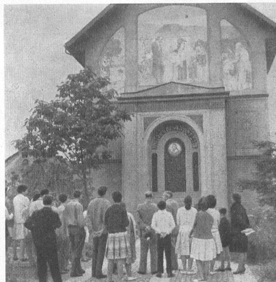
Vor dem Grabdenkmal Pestalozzis (1746–1827 in Birr (Aargau). – Devant le monument funéraire de Pestalozzi (1746–1827) à Birr (Argovie).

Heimatkundliche Exkursionen unter fach- pädagogischer Führung – Excursions à la découverte de la mère patrie sous la con- duite de pédagogues compétents