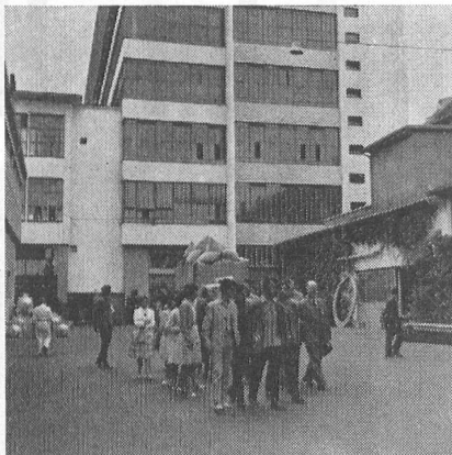
Besuch der Wellfirma Brown, Boveri & Co., Baden (Aargau). – Visite de la célèbre fabrique BBC à Baden (Argovie).