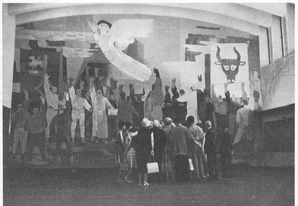
Hier bewundern sie das grosse Wandgemälde Clénins - Ils admirent ici la grande peinture murale de Clénin.

«Home» pour Suisses de l'étranger... un pied-à-terre dans la patrie