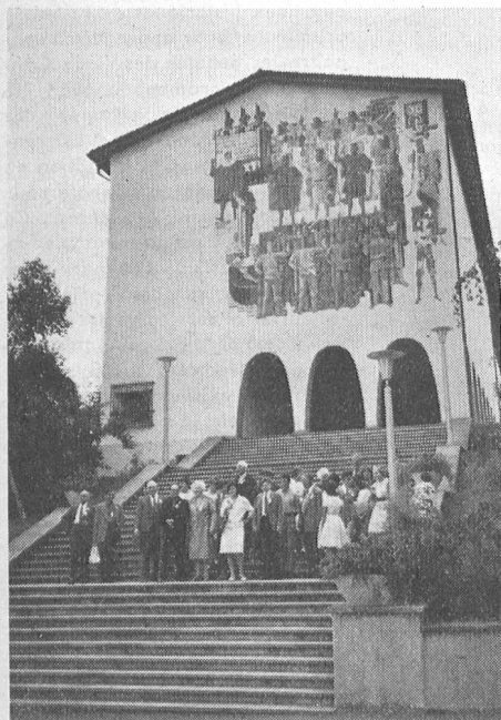
Unsere «Home»-Gäste vor dem Bundesbriefarchiv – Nos hôtes du «Home» devant les Archives fédérales.

Les 25 ans des Archives fédérales de Schwyz