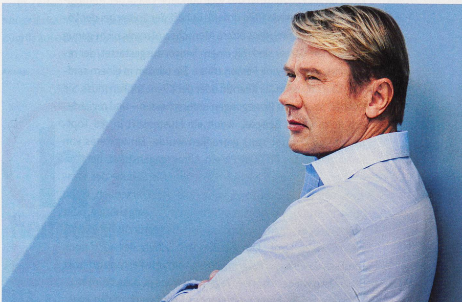
Formel-1-Champion Mika Häkkinen setzt auf die neuesten Hörgeräte von Neuroth

68 x in der Schweiz und in Liechtenstein Kostenlose Info-Tel.: 00800 8001 8001 www.neuroth.com