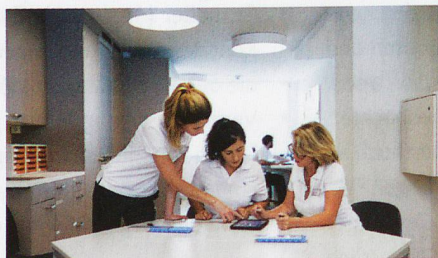
Das Tertianum Pflegepersonal bei der Arbeit mit der mobilen Pflegedokumentation careCoach.

Ende 2017 konnte die erste Phase erfolgreich abgeschlossen werden – 32 Betriebe wurden auf careCoach umgestellt und die Pflegemitarbeitenden in deren Anwendung geschult.