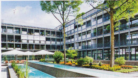
Tertianum Residenz Huob in Pfäffikon/SZ

Es war vor vier Jahren an der IFAS, als zwei Delegierte der Tertianum Gruppe sich nach neuen Pflegedokumentations-Lösungen umsahen. Im Januar 2015 wurde beschlossen, careCoach im neu eröffneten Betrieb «Tertianum Vitadomo Bubenzholz» in Opfikon einzusetzen.