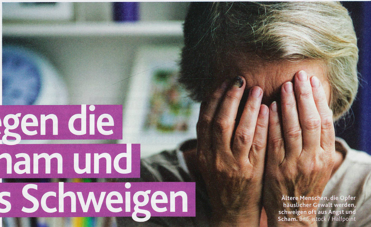
Ältere Menschen, die Opfer häuslicher Gewalt werden, schweigen oft aus Angst und Scham.

Der Spitex Verband Aargau und die Spitex Region Brugg AG spannen mit einer Anlaufstelle zusammen, um ihre Mitarbeitenden für ein ethisch hochrelevantes Thema zu sensibilisieren: häusliche Gewalt. «Häusliche Gewalt gegen ältere Menschen: Erkennen und Unterstützung einleiten» heisst das Pilotprojekt, das allen Pflegefachpersonen klar machen soll, dass häusliche Gewalt viele Gesichter hat – und dass ein Grossteil der Opfer nicht über das Erlittene spricht.