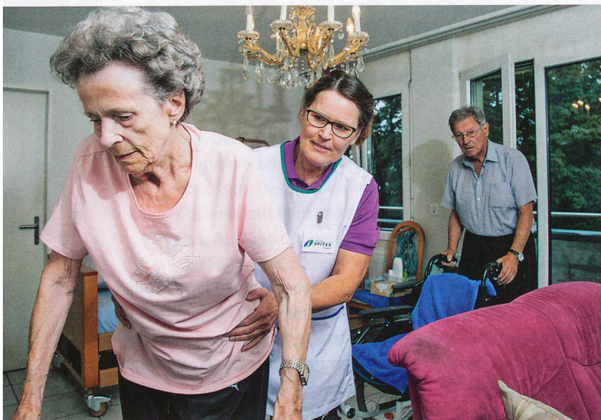
Nicht jede wahrgenommene Schutzbedürftigkeit führt zu einer Gefährdungsmeldung.

Spitex-Fachpersonen können mittels Gefährdungsmeldungen die Kindes- und Erwachsenenschutzbehörde (KESB) auf die Schutzbedürftigkeit von Klientinnen und Klienten aufmerksam machen. Eine Studie der Fachhochschule Nordwestschweiz untersuchte nun die Frage, welche Fachpersonen was melden und warum (nicht)?