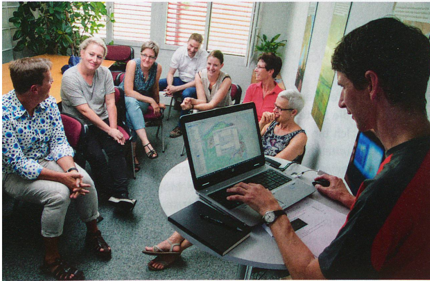
Am Workshop werden die Ergebnisse der Standort- und Gebietsanalyse diskutiert.

Neue Ballungsräume, mehr Einwohner, mehr Verkehr: Spitex-Organisationen müssen frühzeitig auf Veränderungen in ihrer Region reagieren. Eine Standort- und Gebietsanalyse kann helfen, die richtigen Entscheidungen zu treffen. Dazu braucht es viele Daten, eine kluge Software und einen konstruktiven Workshop zum Ideenaustausch.