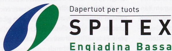
Das neue Logo, exemplarisch eines pro Sprache.

Das neue Logo besteht aus der Bildmarke (die blau-grüne Ellipse), dem Claim – in Deutsch «Überall für alle» –, dem Namen der Organisation (in Grossbuchstaben) und der Ortsbezeichnung darunter. In einem zweijährigen Strategieprozess führte die Agentur Life Science Communication (LSC) im Auftrag des Spitex Verbandes Schweiz Marktanalysen, Umfragen und Workshops durch. Die Analysen bestätigten, dass die Spitex und ihr Logo in der Deutschschweiz einen sehr hohen Bekanntheitsgrad geniessen und deshalb beibehalten werden.