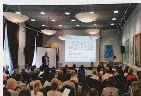
80 Interessenten am Spitex-Tag 2016

Auf enormes Interesse stiess unser Spitex-Tag 2016 in Zürich. Über 80 Personen aus 60 Spitex-Betrieben nahmen daran teil.