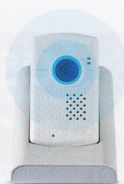
SmartLife Care Mini der diskrete Begleiter mit GPS-Modul