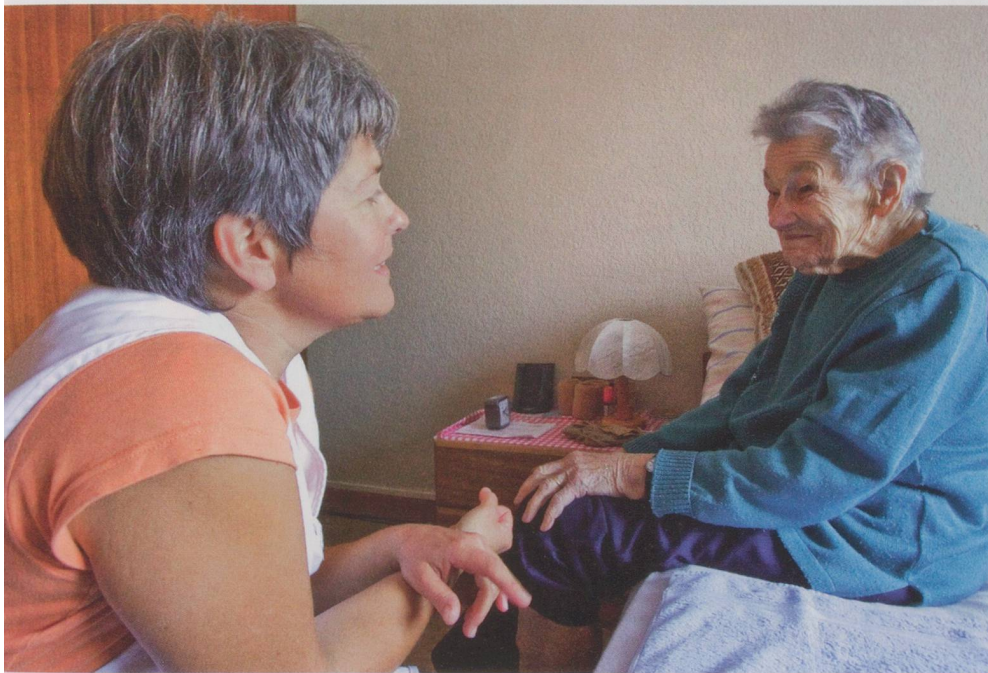
Mängel bei der Umsetzung der neuen Pflegefinanzierung – auch Spitex-Bezügerinnen und -Bezüger zahlen die Zeche dafür.

Die neue Pflegefinanzierung, seit gut vier Jahren in Kraft, wird in den Kantonen sehr unterschiedlich umgesetzt. Jetzt kommen Forderungen zur Optimierung auf den Tisch.