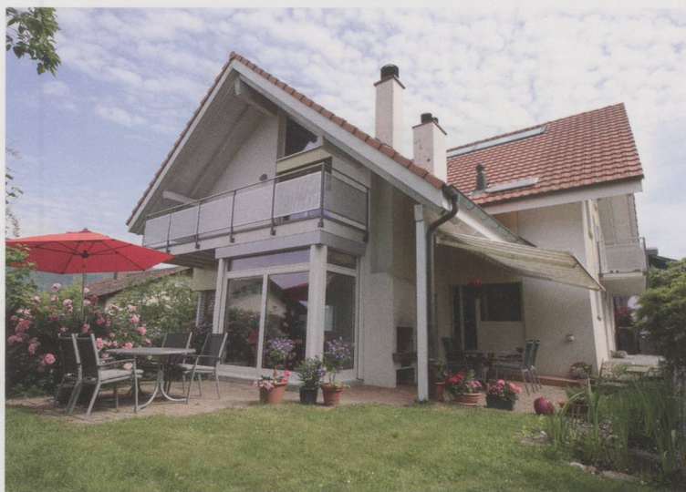
Haus Silsana in Ipsach (BE), das Haus für Pflege und Betreuung.