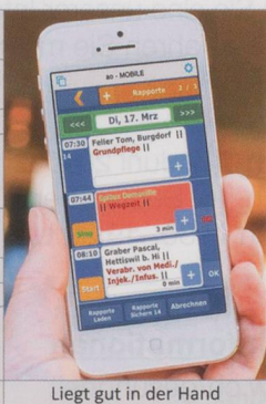
Liegt gut in der Hand

Eine gute Spitex-Administration ist einfacher als Sie denken. a-office MOBILE