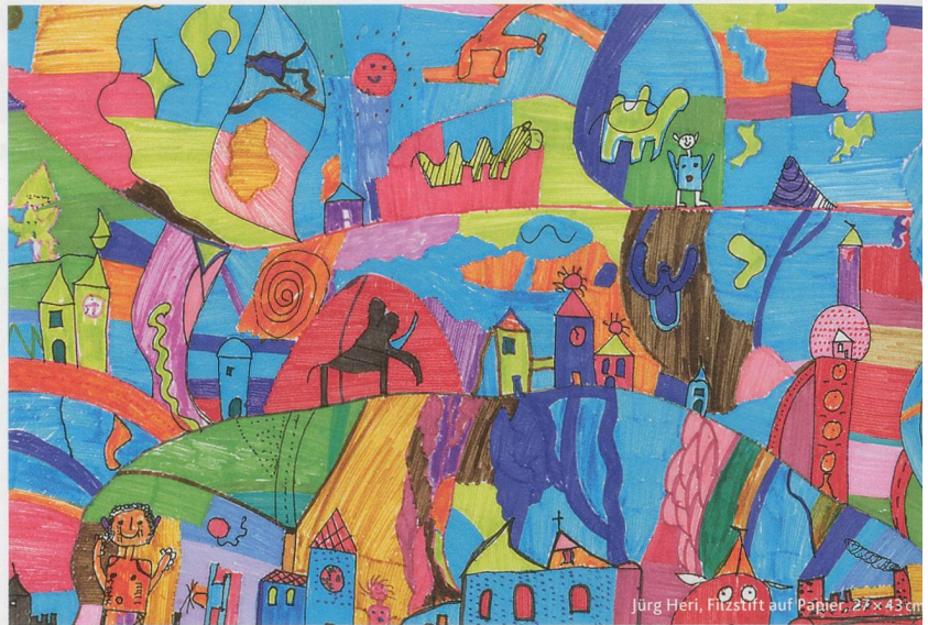
Jürg Heri, Filzstift auf Papier, 27 x 43 cm

Dann kommen je nach individueller Situation Optionen wie eine RAI-HC-Bedarfsabklärung, ein Gespräch am runden Tisch mit den Angehörigen und dem Hausarzt oder der Beizug eines Seelsorgers zum Zug. Eine weitere Möglichkeit besteht im Erstellen eines Geno-/Ökogramms, in dem das gesamte soziale Netz eines Kunden – inklusive Haus-tieren – aufgeführt wird. «Hat der Kunde seine Kontakte vor Augen, wird ihm manchmal bewusst, dass er sich bei