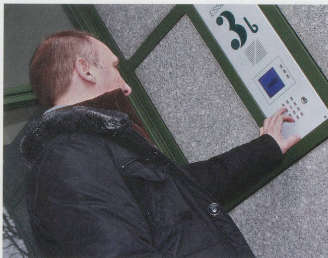
... liebt er die Vielseitigkeit seines Berufes.

rig – zog er nach Frankreich. Ende der Neunzigerjahre arbeitete er im Burgund, später dann, um seiner italienischen Heimat näher zu sein, in der Region Hochsavoyen, südlich von Genf. Immer arbeitete er als Hauspfleger, überzeugt, dafür geboren zu sein.