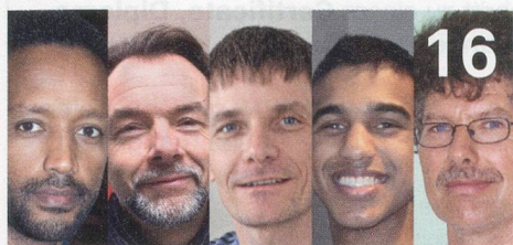
Pflegende Männer: Spitex-Mitarbeiter erzählen aus dem Berufsalltag