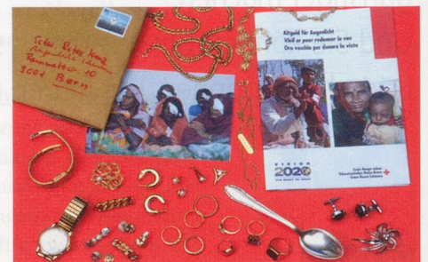
Dank Altgoldspenden können Blinde wieder sehen. 50 Franken kostet eine Graue-Star-Operation.

Wenn Sie beim Zahnarzt eine Behandlung machen müssen, können Sie das extrahierte Zahngold dem Roten Kreuz spenden. Die Zahnärzte in der Schweiz sind informiert und stellen Ihnen reissfeste Kuverts zur Verfügung.