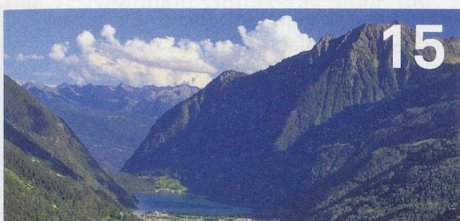
Aufgefallen: Betreuung im Puschlav

Titelbild: Gabriel Hopf, Pflegefachmann und Triathlet (Meine Spitex S. 10).