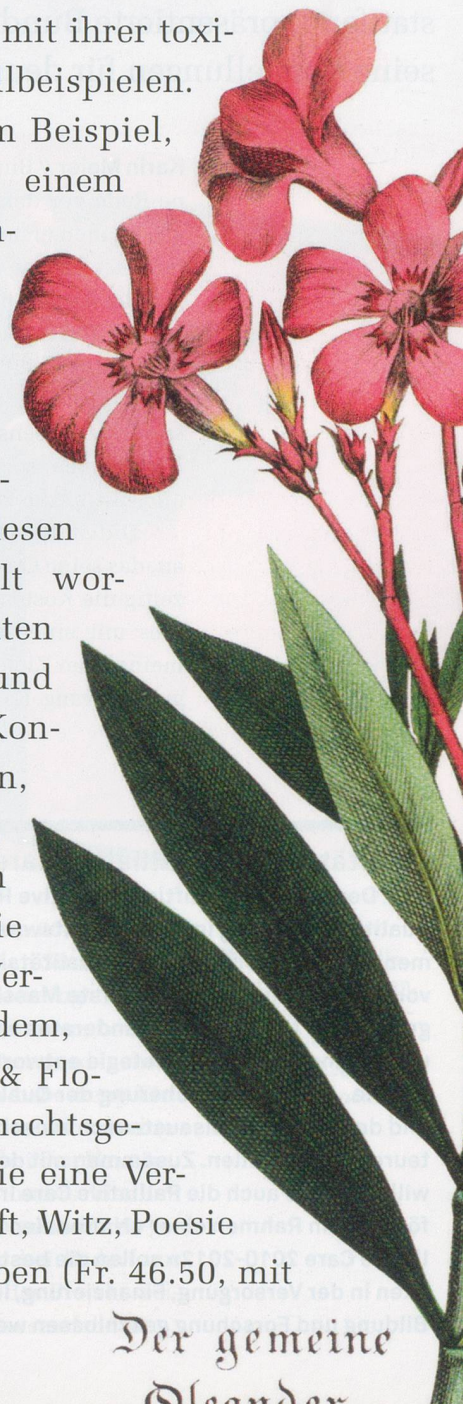
Der gemeine Oleander