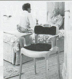
Nachtstuhl SWIFT Commode

Leichter durch den Alltag Produkte für mehr Lebensqualität