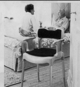
Nachtstuhl SWIFT Commode

bimeda Leichter durch den Alltag Produkte für mehr Lebensqualität