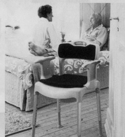
Nachtstuhl SWIFT Commode

bimeda Leichter durch den Alltag Produkte für mehr Lebensqualität