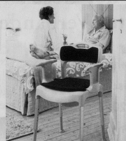
Nachtstuhl SWIFT Commode