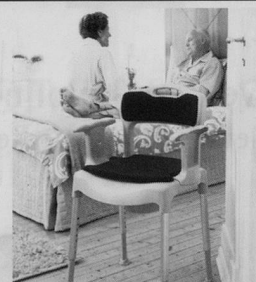
Nachtstuhl SWIFT Commode