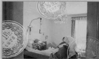
Die Verordnung legt u. a. fest, wer Anspruch auf Leistungen hat.

Die Tarifordnung für Organisationen der häuslichen Pflege und Betreuung, das Reglement für den Austausch von Pflege- und Betreuungskräften und den Einsatz von überregionalen Organisatio-