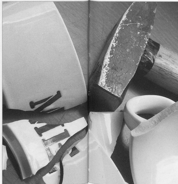
Herausforderung für die Spitex: Menschen mit starken Aggressionen.

Das bezieht sich insbesondere auf die Tatsache, dass das Fachpersonal primär dann im Einsatz ist, wenn eine psychiatrische Diagnose vorliegt. Bei psychosozialen Fällen liegt es im Ermessen der Fachpersonen, ob sie direkt den Einsatz mitmachen oder lediglich für das Personal als Coachingpartner zur Verfügung stehen. Diese «Wahlfreiheit» kann zu Spannungen führen, da die Spitex-Basisdienste aufgrund der Leistungspflicht solche Freiheiten nicht haben.