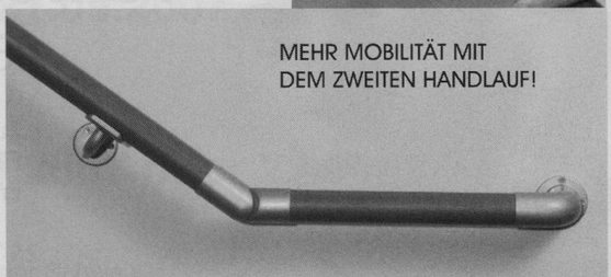
MEHR MOBILITÄT MIT DEM ZWEITEN HANDLAUF!